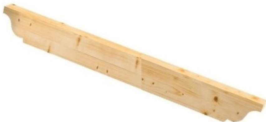
Palombella 2 Lati