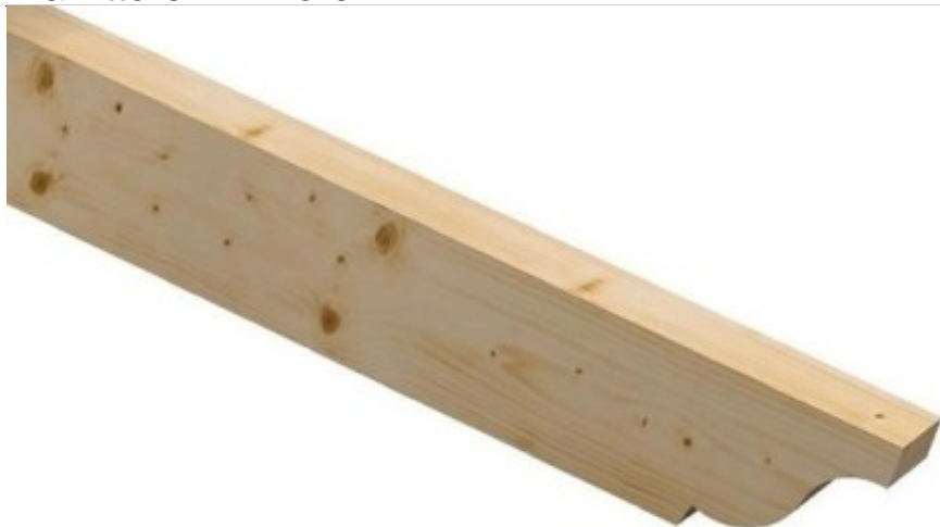
Palombella 1 Lato