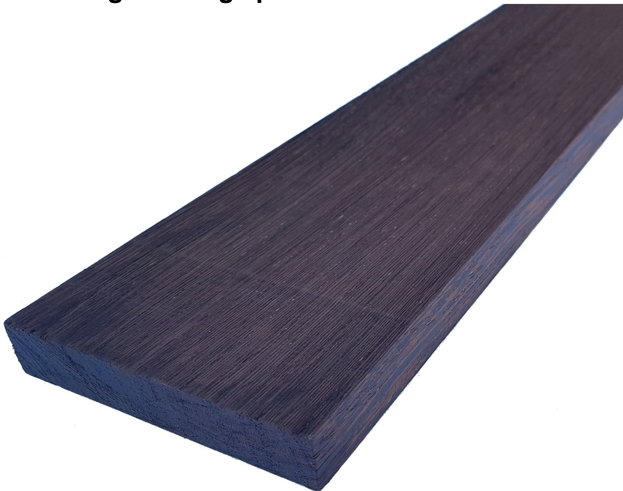
Tavola in legno Massello di Wengè

Tavola legno Wengè piallato mm 22 x 130 x 2000