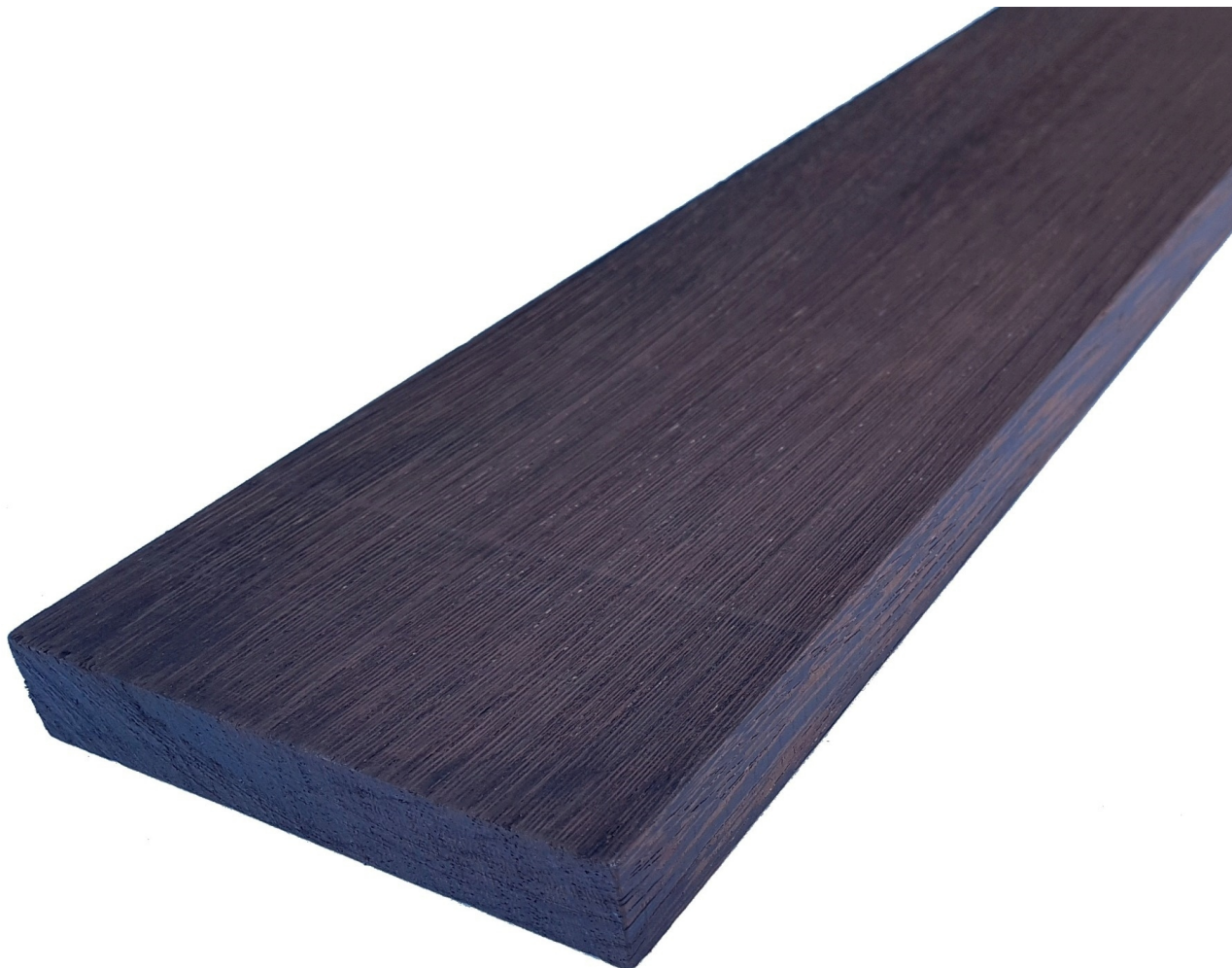
Tavola in legno Massello di Wengè grezzo - Bricolegnostore