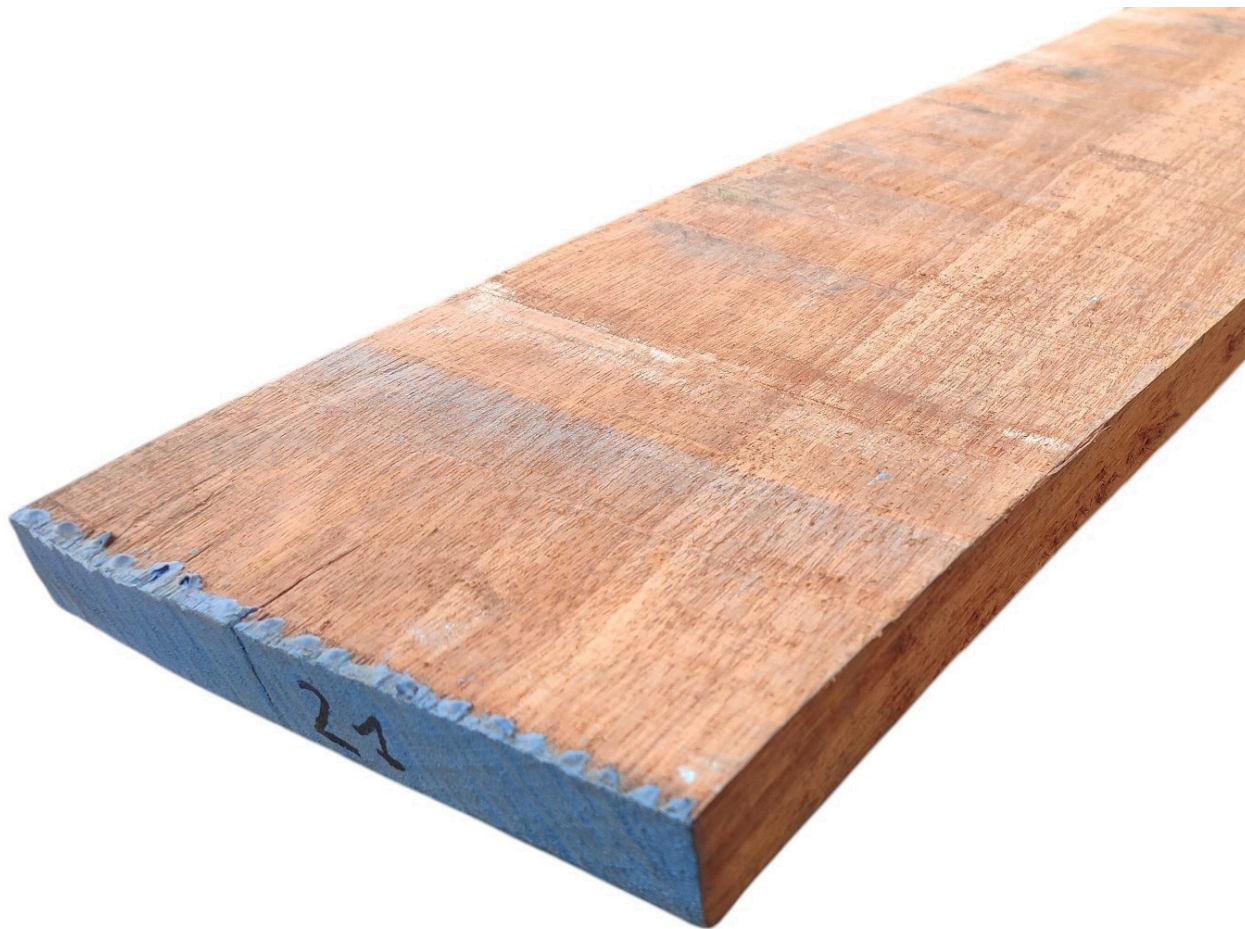
Tavola Legno di Doussié Refilato Grezzo