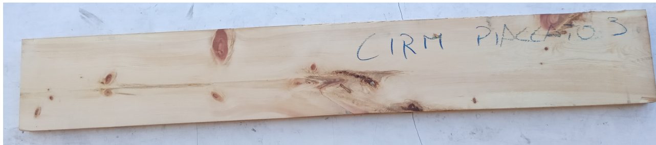
Tavola Legno di Cirmolo Refilato Piallato mm 43 x 220 x 1520