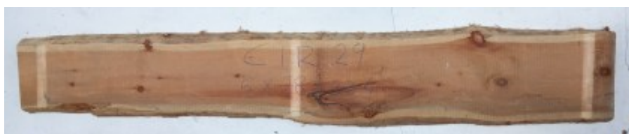
Tavola in legno massello di Cirmolo o Pino Cembro. Le foto al lato identificano la tavola oggetto della vendita. Si precisa che la misurazione viene prelevata verso il centro della tavola mediando la larghezza di entrambi i lati. Possibilità di piallatura sulle 2 facce, tale lavorazione ridurrà lo spessore di circa 10/12 mm.