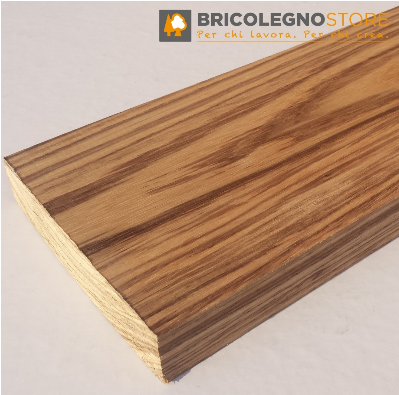
Tavola legno di Belì Refilata Grezza mm 35 x 120 x 1900