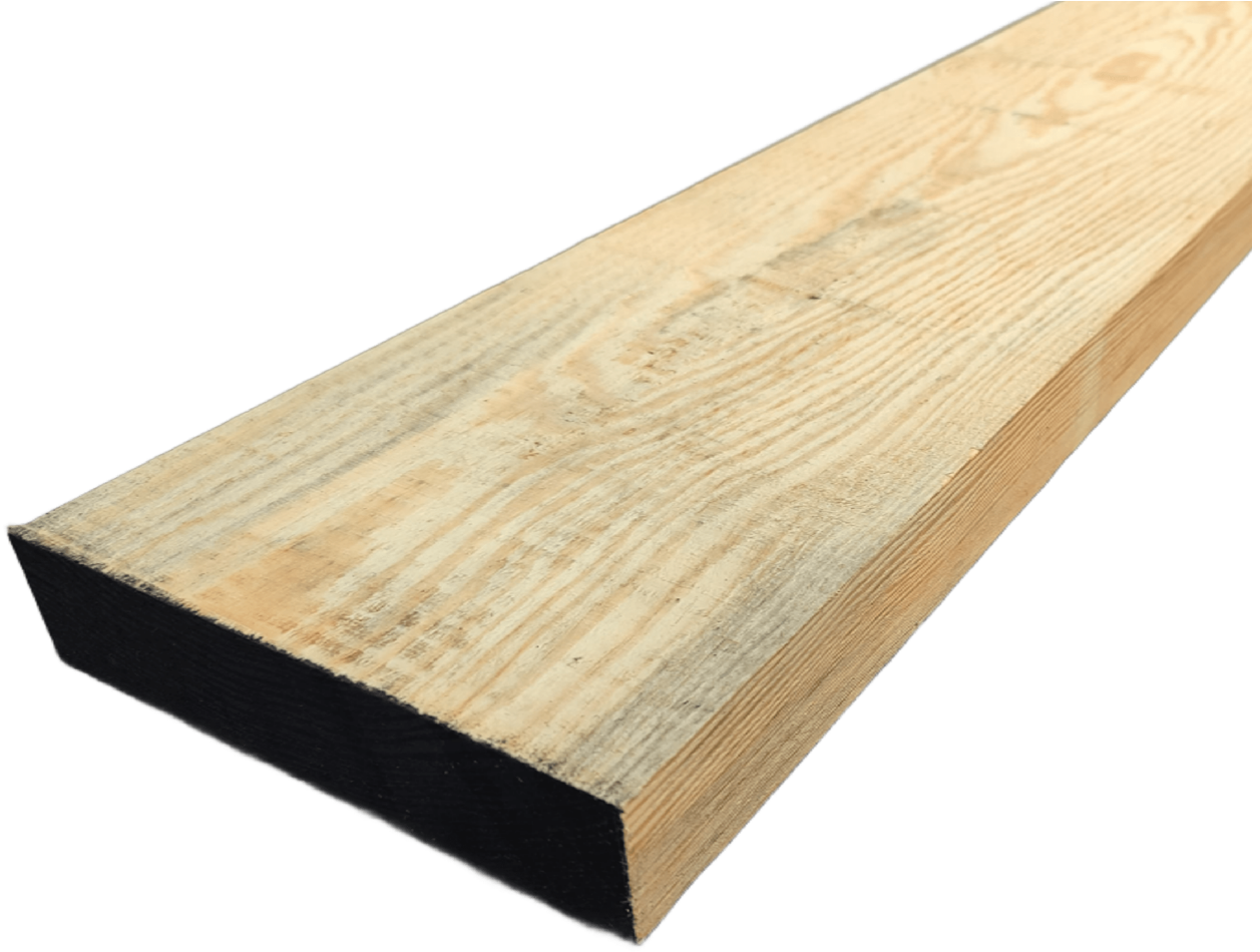
Tavola in legno di Pino Giallo grezzo (o Yellow Pine Americano) mm 40 x 110 x 2100