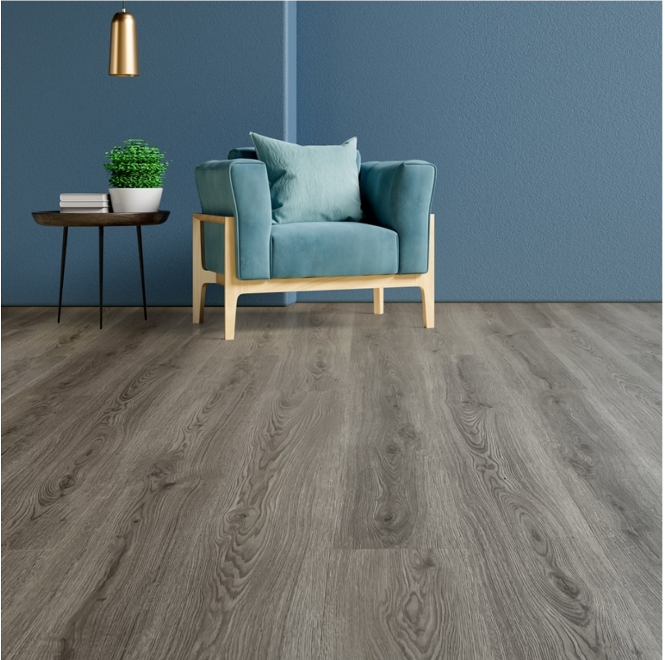
Pavimento Parquet in ESPC