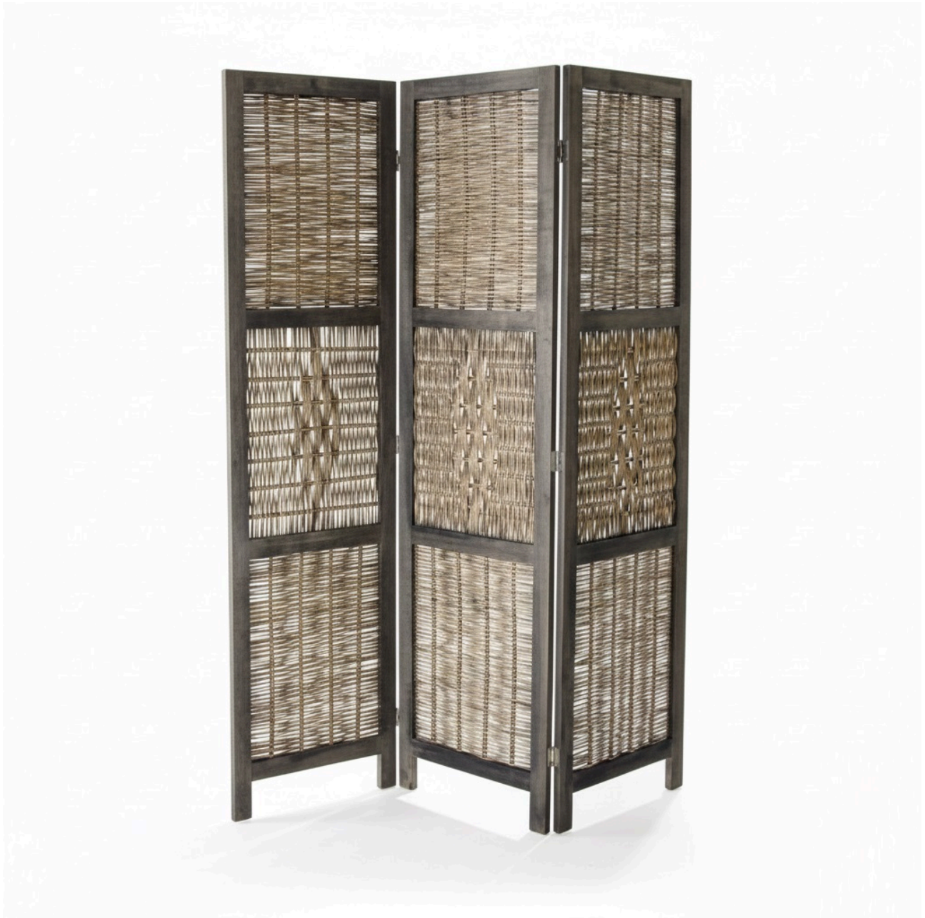
Paravento Pieghevole a 3 Ante in Legno e Bambù Modello Norma