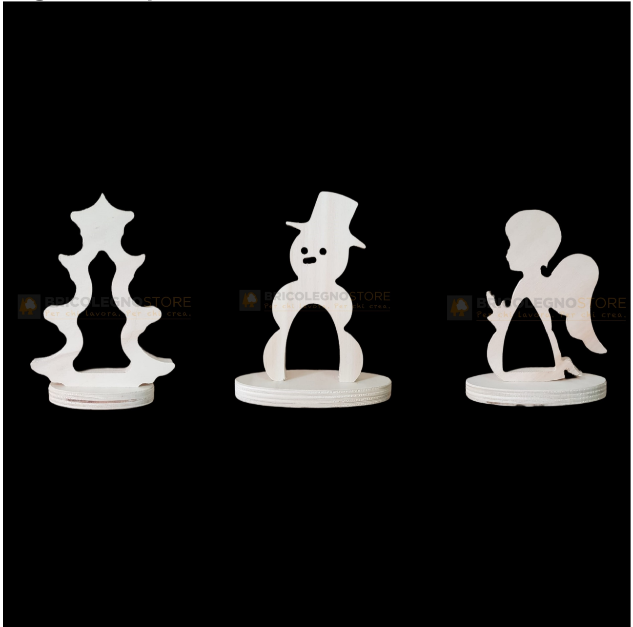
Mini telai per luminarie salentine Natalizie