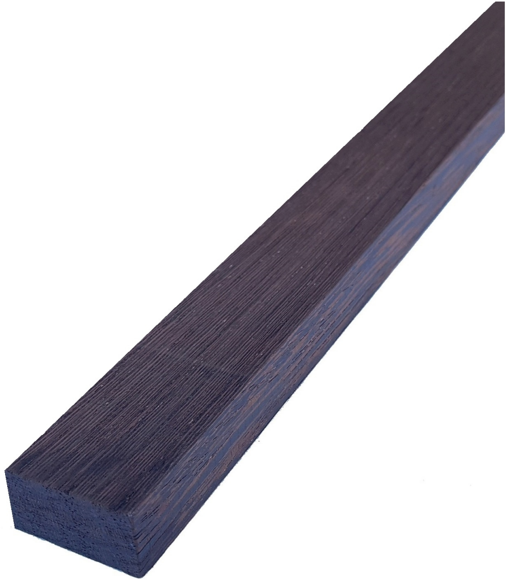
Tavola in legno Massello di Wengè grezzo - Bricolegnostore