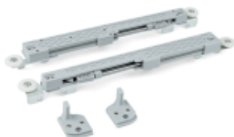
SET FRENI CHIUSURA SLOWMOVE