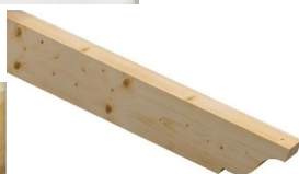
Palombella 1 Lato