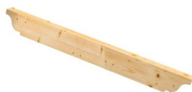
Palombella 2 Lati

Classe di resistenza GL24H. Possibilità di fornire la trave lamellare con sagoma a palombella su un lato o entrambi i lati, selezionando tale lavorazione tra le varianti proposte.