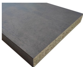
Top per cucina in Truciolare Stratificato HPL finitura PIETRA OSSIDO