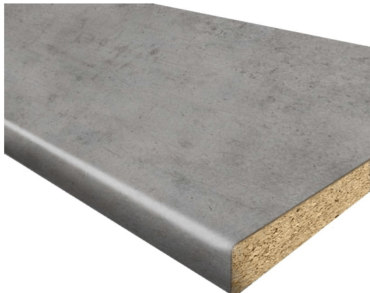
Top per cucina in Truciolare Stratificato HPL finitura GRIGIO CEMENTO