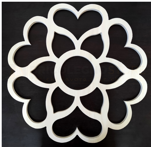
Telaio per Luminaria Sag. 46 Diametro mm 590 - Bricolegnostore