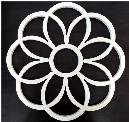
Telaio per Luminaria Sag. 42 Diametro mm 590 - Bricolegnostore