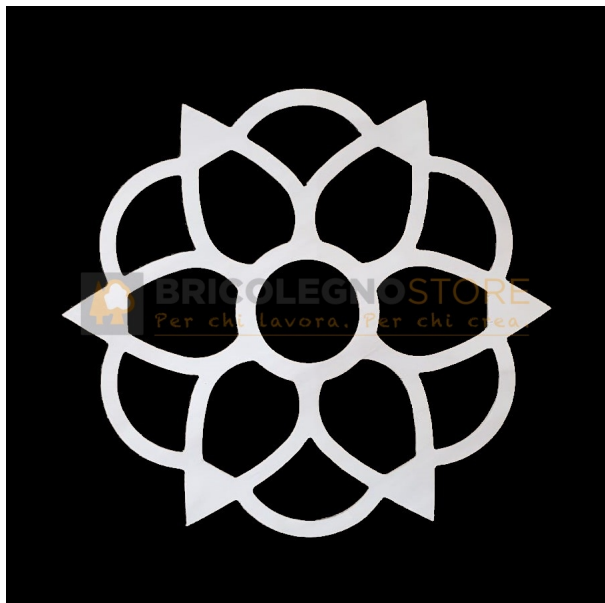
Telaio per Luminaria Sag. 124 Varie Dimensioni