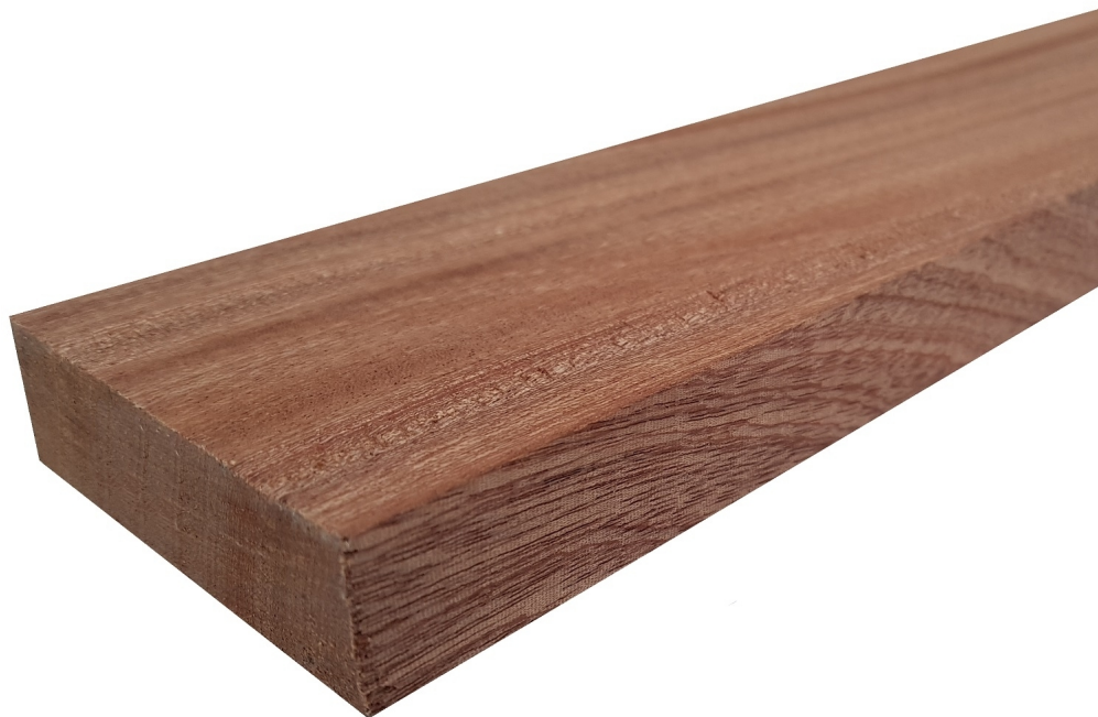
Tavola legno di Mogano Sapelli Refilato Piallato mm 10 x 130 x 1750