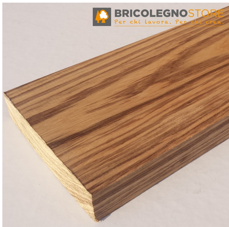
Tavola legno di Belì Refilata Grezza mm 35 x 220 x 2050