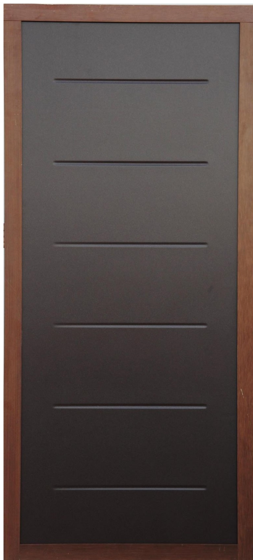
per Porta Blindata Varie Finiture mod. Camelia