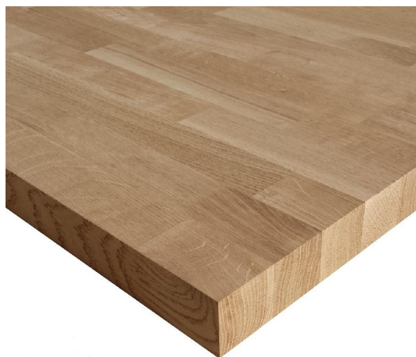
Pannello, in, legno, lamellare, di, rovere, bricolegnostore69