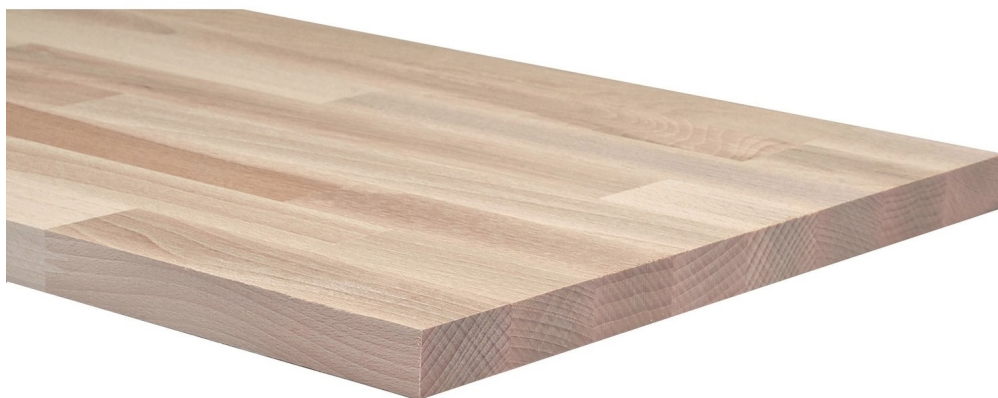
Pannello in legno Lamellare di Faggio