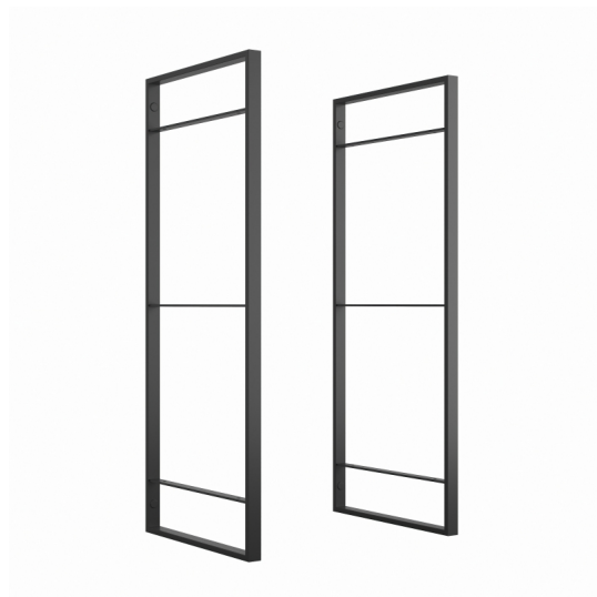
Emuca Struttura per Scaffale Lader, 830, Verniciato nero, Acciaio