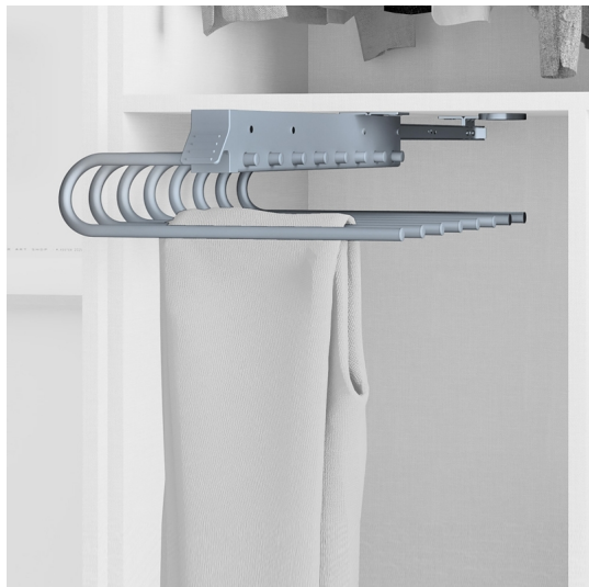
Emuca Porta pantaloni estraibile, Sinistra, Verniciato alluminio, Acciaio e Tecnoplastica