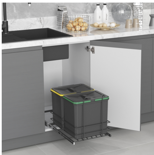
Emuca Pattumiera per differenziata Recycle da cucina, 2 x 16 L, fissaggio sul fondo ed

estrazione manuale, Tecnoplastica grigio antracite