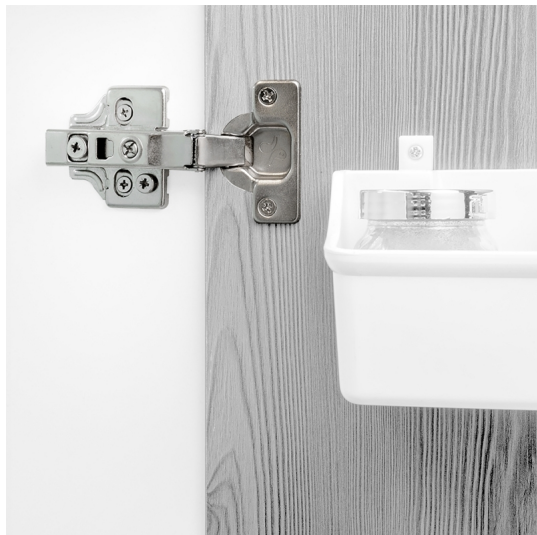
Emuca Kit cerniera a scodellino di collo alto X91 con chiusura ammortizzata e bassetta