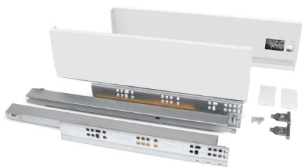
Emuca Cassetto esterno Vertex 40 kg altezza 93 mm, 450, Verniciato bianco, Acciaio