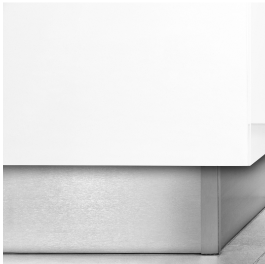
2,35 m, Plastica nera, Tecnoplastica