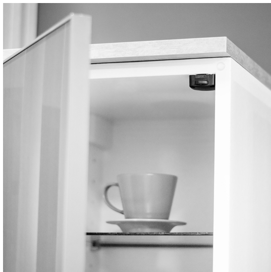
Emuca Interruttore per ante di armadio, Plastica, Bianco, 10 u.