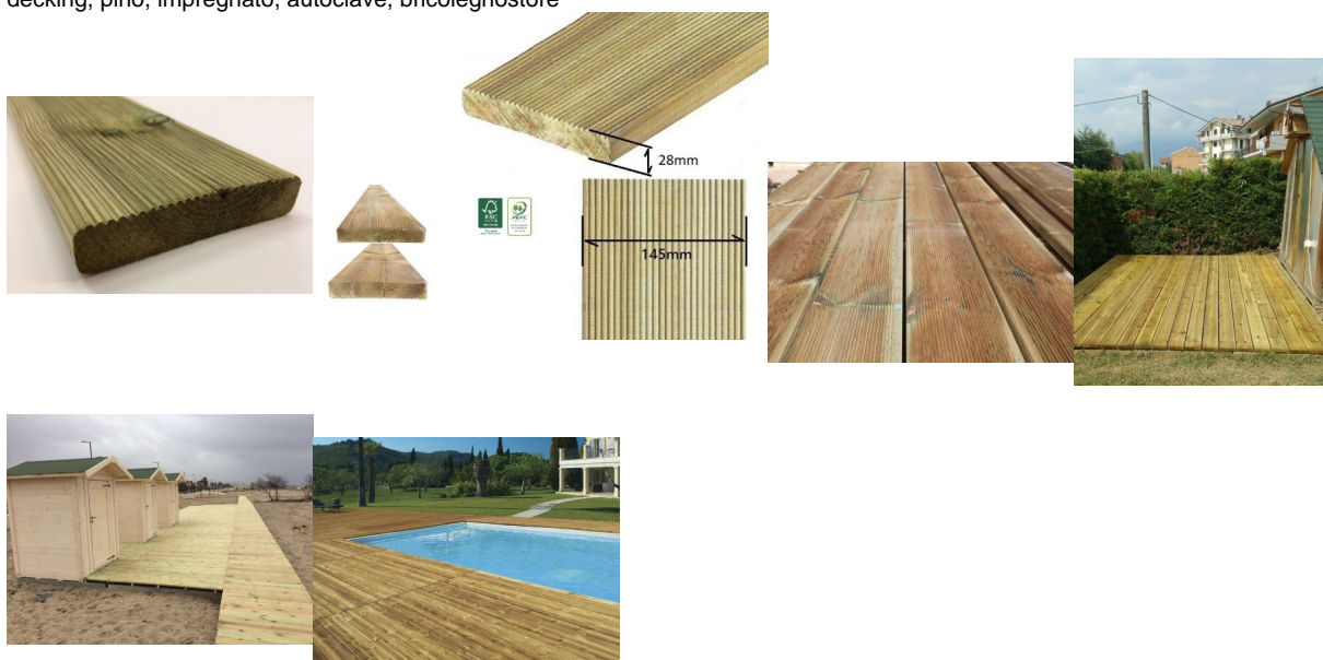
Pavimento, legno, per, esterno,

Il decking in legno di Pino grazie all'aspetto naturale e alle ottime caratteristiche tecniche, è la scelta ideale per creare pavimentazioni esterne. Grazie a questo trattamento il legno di Pino è protetto da muffe, insetti e agenti atmosferici, garantendo una lunga durata nel tempo.