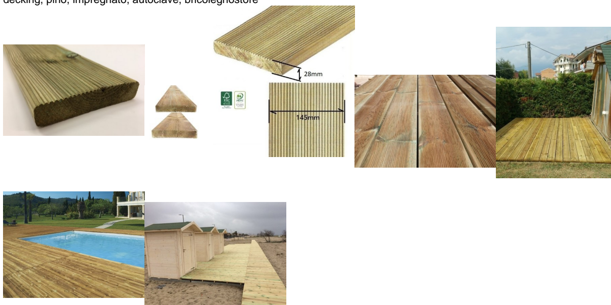
Pavimento, legno, per, esterno,

Il decking in legno di Pino grazie all'aspetto naturale e alle ottime caratteristiche tecniche, è la scelta ideale per creare pavimentazioni esterne. Grazie a questo trattamento il legno di Pino è protetto da muffe, insetti e agenti atmosferici, garantendo una lunga durata nel tempo.