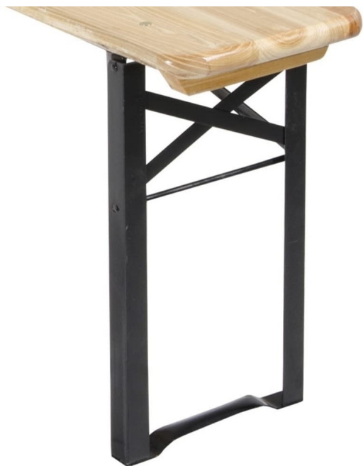
Coppia Gambe in Acciaio Pieghevoli per Panche