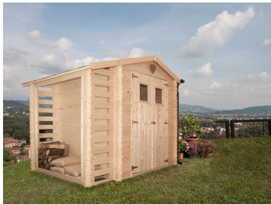
Casetta con legnaia ava cm. 200x200 - Casette in abete grezzo - Losa Esterni da