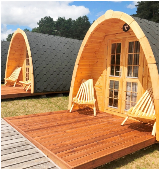
Camping pod cm. 300x600 - Camping pod - Losa Esterni da vivere