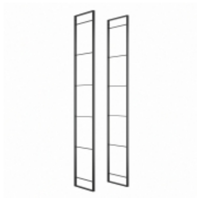
Scaffale Lader. 1790. Verniciato nero, Acciaio