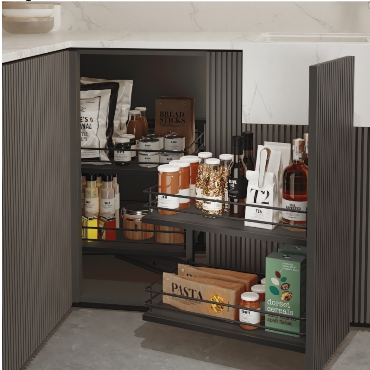
Emuca Angolo estraibile Titane per mobili da cucina, apertura a Sinistra, Grigio antracite, Acciaio e Legno