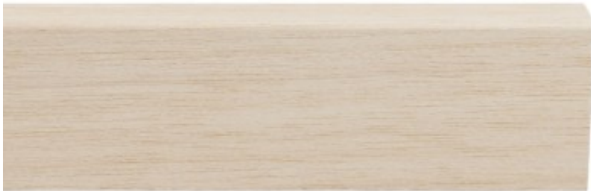
COPRIFILO MULTISTRATO IMPIALLACCIATO