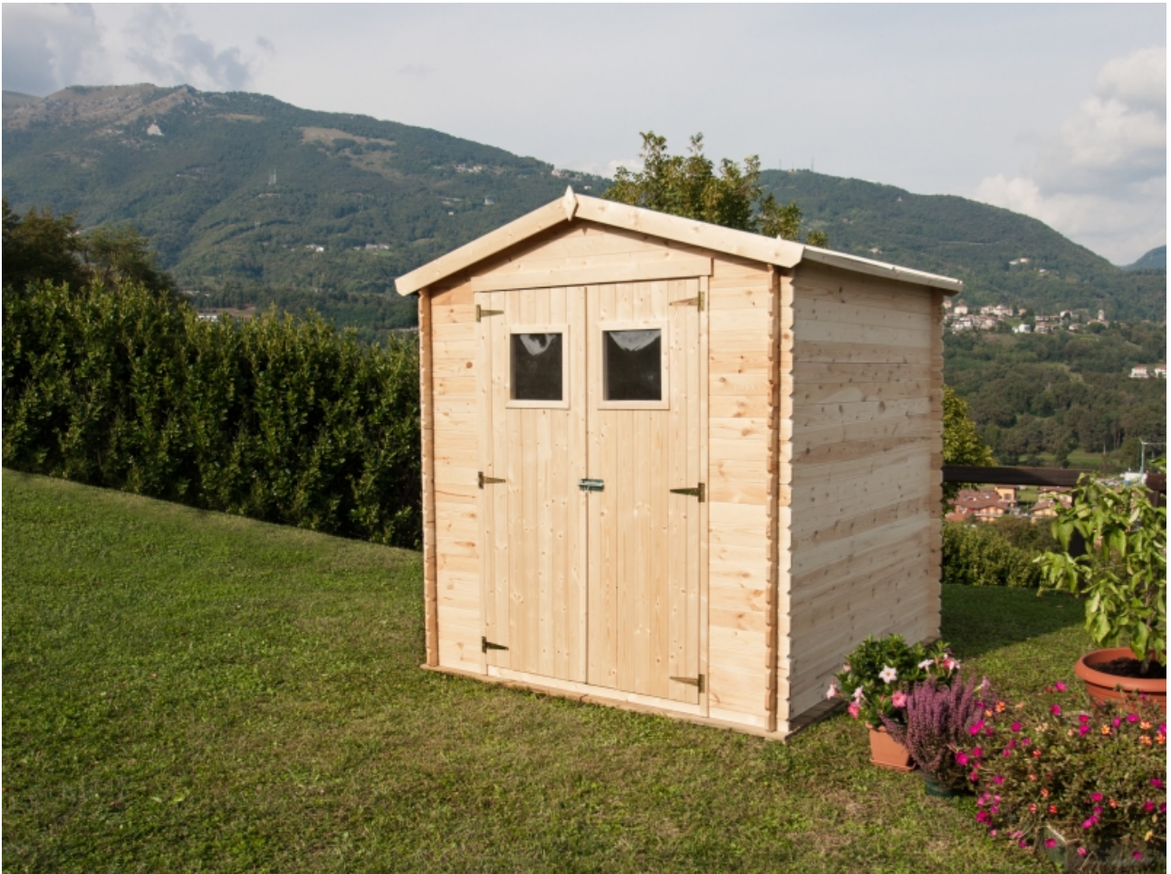
Casetta giada 180x130 - Casette in abete grezzo